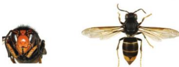
Frelon asiatique à pattes jaunes, Vespa velutina

Le frelon est reconnaissable car il est majoritairement noir, avec une large bande orange sur l'abdomen et un liseré jaune sur le premier segment. Sa tête vue de face est orange, et les pattes sont jaunes aux extrémités. Il mesure entre 17 et 32mm.